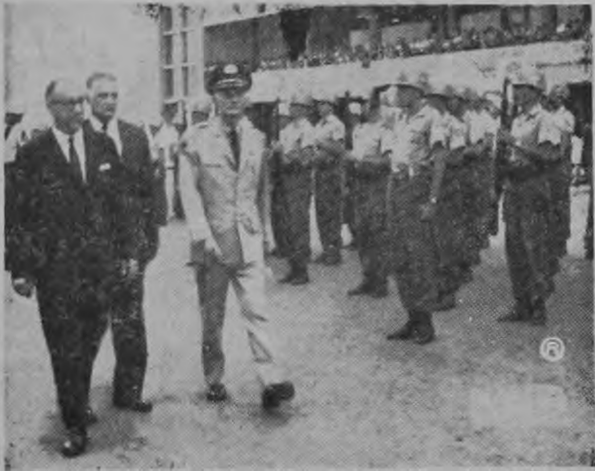
La foto captó la llegada del Presidente Orlich al aeropuerto El Coco para esperar al Presidente Villeda Morales. Posteriormente se supo que aterrizaría en Puntarenas. Junto al Presidente el coronel Delcore y el Ministro Goicoechea.

Profunda conmoción causó ayer en nuestro país la noticia de la caída de Villeda Morales causada por un golpe de las fuerzas armadas de su país, una semana después de que Villeda de clarara a los periodistas costarricenses que acompañaron al Presidente Orlich en su gira por El Salvador, Honduras y Nicaragua, en las que manifestó que "confiaba en la lealtad del Ejército y estaba seguro de que este haría respetar la institucionalidad y el resultado de las elecciones a realizarse el domingo próximo.