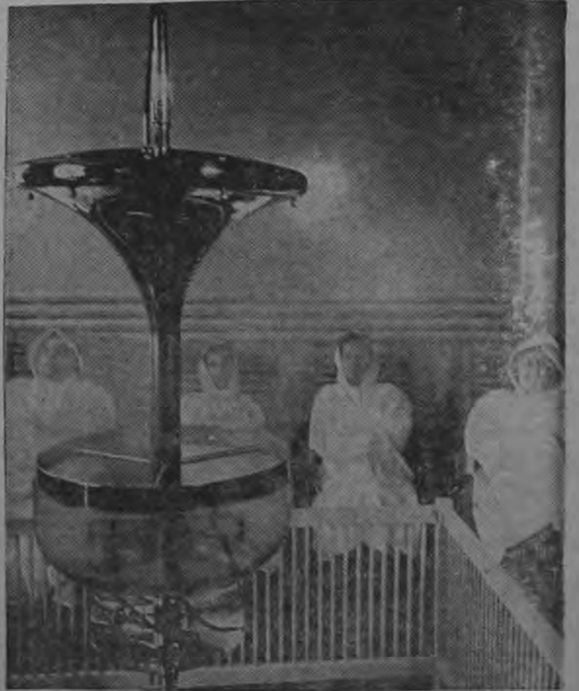
UNA NIEBLA CURATIVA aspiran estos pacientes en el inhalatorio del Bad Salzuflen en la región de Renania del Norte y Westfalia (República Federal de Alemania). En este inhalatorio se pulveriza la sal en forma de fina niebla, que inspirada profundamente penetra hasta las más finas ramificaciones bronquiales y alivia los catarros de los órganos respiratorios. Las batas de que se revisten los pacientes sirven para proteger los vestidos de la atmósfera salina de este local. Salzuflen es conocido por sus fuentes salinas termales ferrosas y carbónicas y por sus otras tres fuentes salinas. Tiene además otras fuentes curativas y es muy visitado por los enfermos de bronquitis y del aparato circulatorio. También se le recomienda para el reumatismo, las enfermedades de la mujer y al...