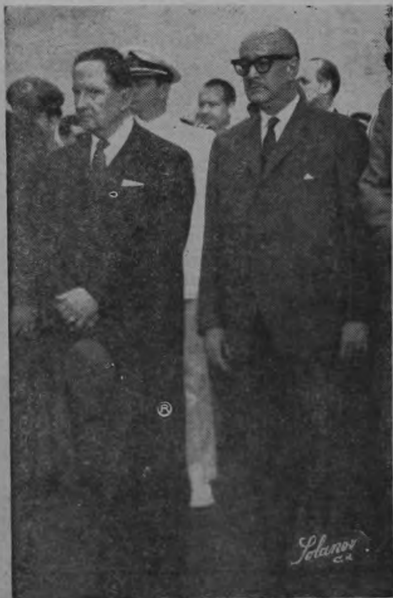
DOS PRESIDENTES depuestos por las fuerzas militares: Ydígoras Fuentes y Villeda Morales.