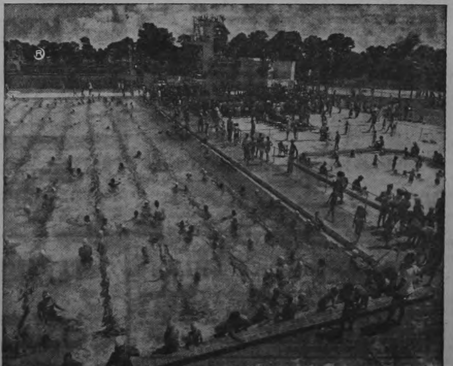
Aspecto de la bellísima piscina olímpica, y a su lado la piscina de tamaño corriente, del Country Club de Alajuela

Los grupos que organizan el baile, el té, el concurso, las rifas, todos están trabajando empeñosamente en lograr que la inauguración de este hermoso club y el resultado económico para el pabellón nuevo del Hospital, sean lo mejor de lo mejor que se ha hecho en la provincia.